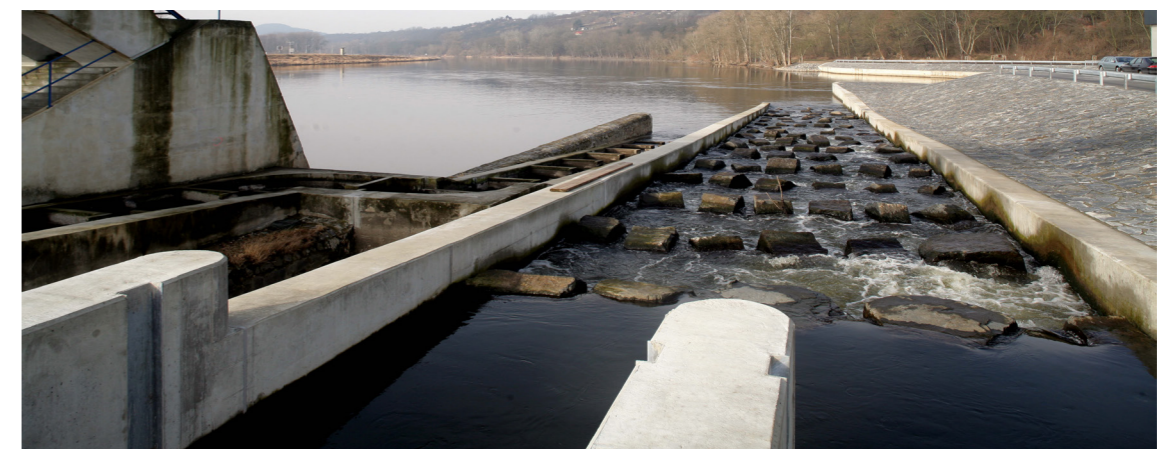
Součástí stavby elektrárny se staly dva rybí přechody