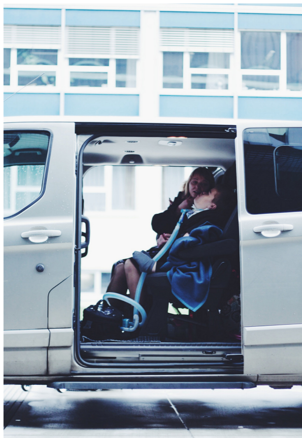
Devítimístný automobil posloužil během roku k mnoha důležitým cestám.

Zaměstnanci střediska se také podílejí na distribuci (provoz služebního automobilu Ford Turneo Custom) ošetrovatelských pomůcek jako výpomoc rodinám, pečujícím o vážně a nevléčitelně nemocné dítě v domácím prostředí a podílejí se na návštěvách a konzultacích u těchto rodin.