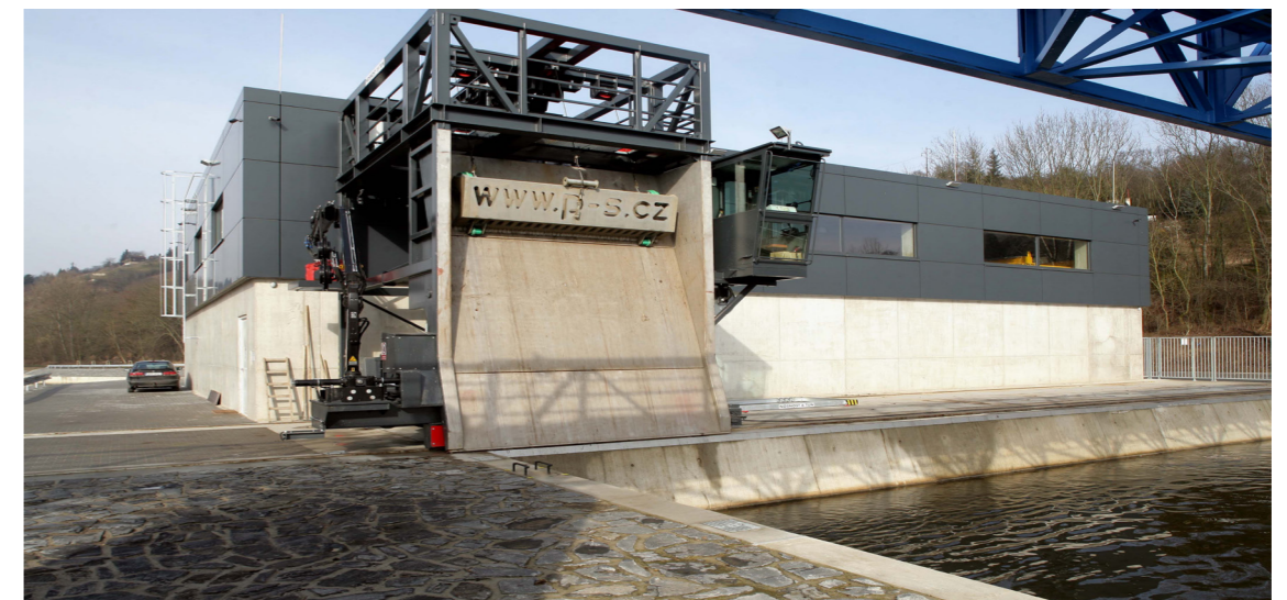
Čistící stroj česlí před halou MVE na vtoku elektrárny