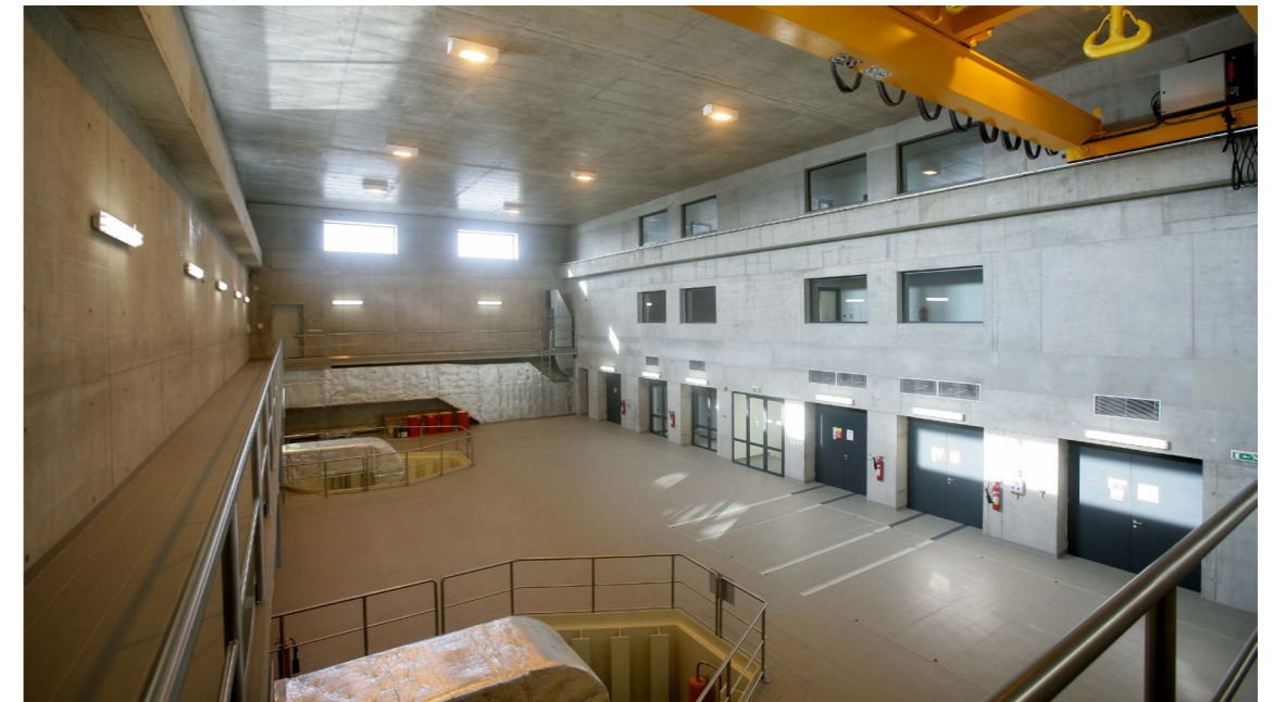
Provozní hala elektrárny